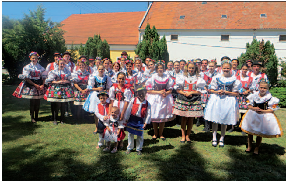
Měnínská chasa, 2016