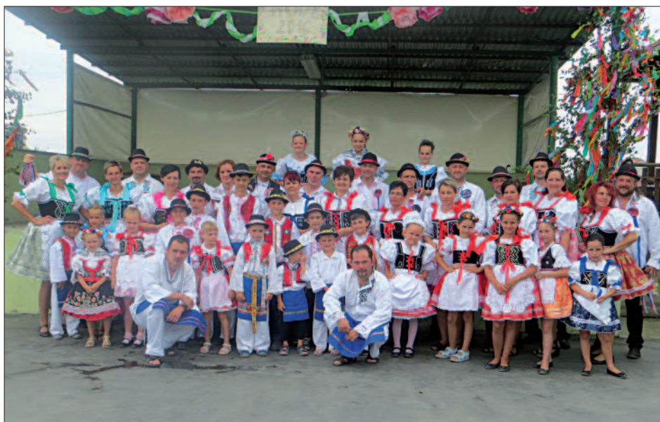
Pondělí patří „ženáčům“, 2016