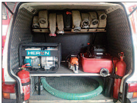
Zrekonstruované zásahové vozidlo – VW Transporter