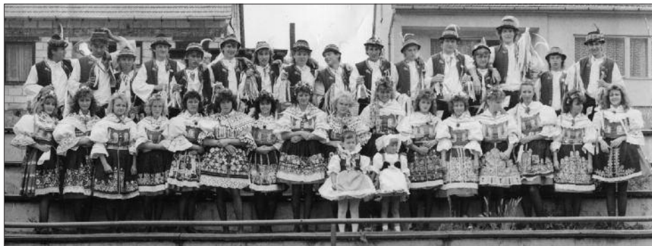
Společné hody, 1989

V době okupace v letech 1939 až 1944 byly veškeré kulturní akce zakázány. První poválečné hody se konaly na počest ukončení války na tehdejší Orelském cvičišti v Hliníkách. Tyto hody organizovaly obě tělovýchovné organizace společně. Další roky byly pořádány opět odděleně, tzn. jak organizací Sokol, tak Orel. Tuto dvojakou podobu měly hody až do roku 1950, ve kterém došlo ke sjednocení tělovýchovy. V letech následujících se hodování odehrávalo pouze v sokolovně. Velké a hodně navštěvované byly především sobotní zábavy. Nedělní dopoledne bylo ve znamení sportovních utkání jak v házené, tak také ve fotbale. Významné byly návštěvy družebního fotbalového družstva z Lubence v letech 1977–1979.