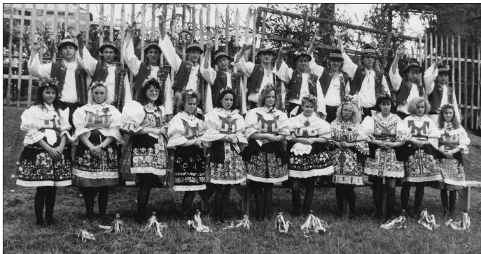
Hody v roce 1992 pořádané SK Měnín

Neděle je hlavním svátečním dnem. Dopoledne začíná slavnostní bohoslužbou za účasti stárků, při které kněz hodům požehná. Odpoledne prochází obcí průvod stárků za doprovodu dechové hudby. U domu každé stárky tančí v kole. Dům hlavní stárky je ozdoben malou májí, nechybí u něj posezení s pohoštěním. Celý průvod končí v areálu hřiště, kde nejprve děti v krojích tančí na melodii lidových písní a následně stárci zatančí Moravskou besedu.