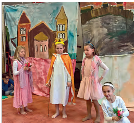
Krok a jeho dcery