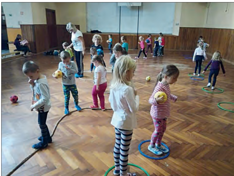
Mateřská škola se zapojila do projektu „Škola v pohybu“. Zkušení fotbaloví trenéři připravují pro děti zábavné hodiny zaměřené na všeobecný pohybový rozvoj dětí