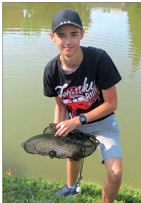
Soutěž rybářského mláďí, 7. června 2018 ▲ ▶