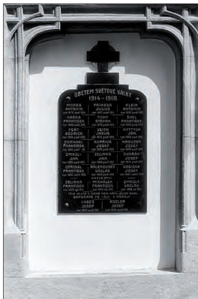
Pamětní deska se jmény měninských občanů, padlých a nezvěstných v době první světové války. Je umístěna na zdi kostela sv. Markéty

(Článek je doslovným opisem textu z publikace „MĚNÍN v minulosti a dnes“ od Mgr. Hany Kalábové, vydané v roce 2000.)