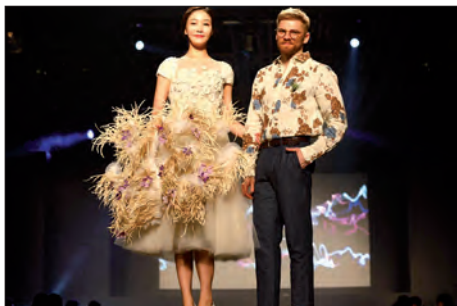
Módní a květinová přehlídka – Jižní Korea / Soul