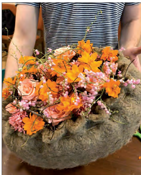
Ukázka práce z pracovního semináře pro floristickou organizaci – Indie / Kalkata