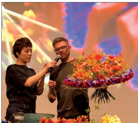
Květinová demonstrace pro publikum – Jižní Korea / Soul