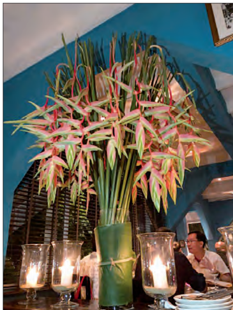
Dekorace hotelu – Thajsko / Bangkok