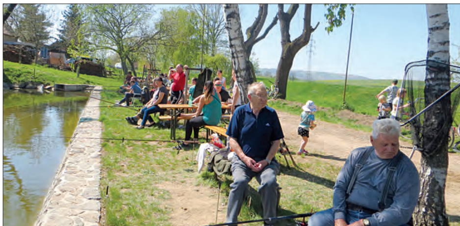
Závody dospělých rybářů, 27. dubna 2018 ▲