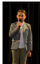
Připravila Petra Kiršová a Helena Baxantová