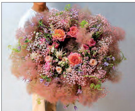
Květinová přednáška – Vietnam / Ho Či Minovo město