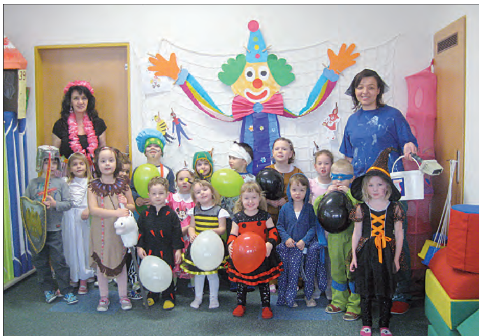
Maškarní ples třídy Soviček ▼