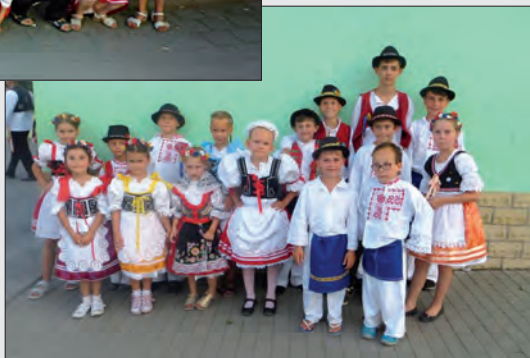
Děti na hodech – 2010 ▲, 2016 ►