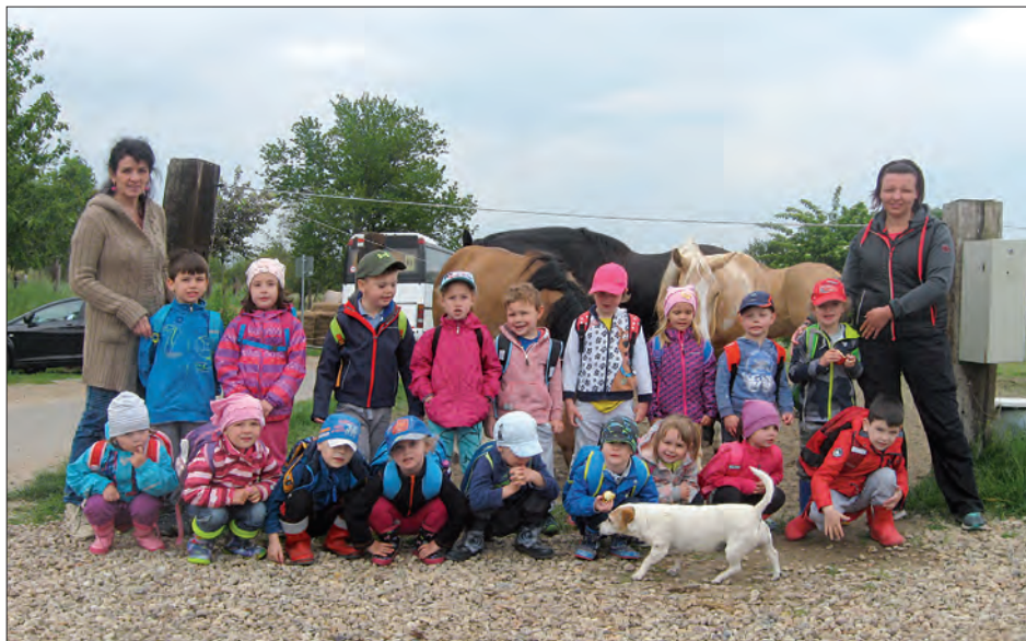
Sovičky na Ranči Valkýra ▲