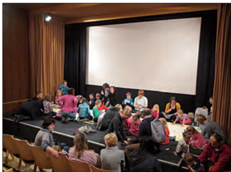
Filmový klub Junior ▲ Tvoření filmové postavičky ▼ Jedno filmové okénko ►