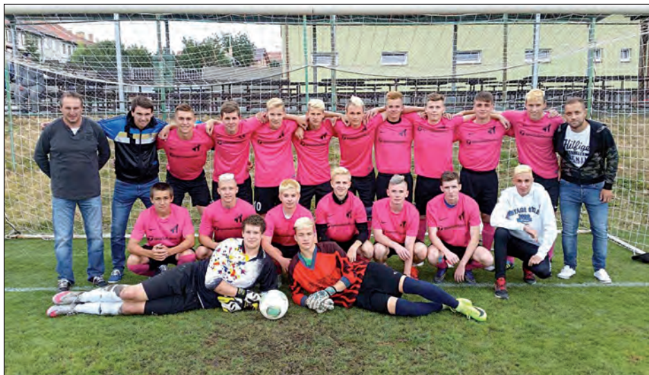
Družstvo dorostu Měnin/Újezd u Brna se stalo vítězem 1. třídy dorostu Jihomoravského kraje