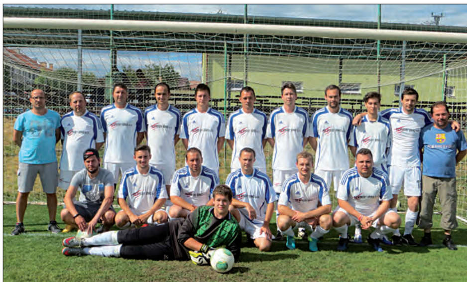
B mužstvo mužů díky výhře 4:1 v posledním zápase nad protihráčem RAFK B skončilo na 9. místě v tabulce III. třídy skupiny A