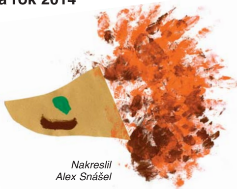
Nakreslil Alex Snášel