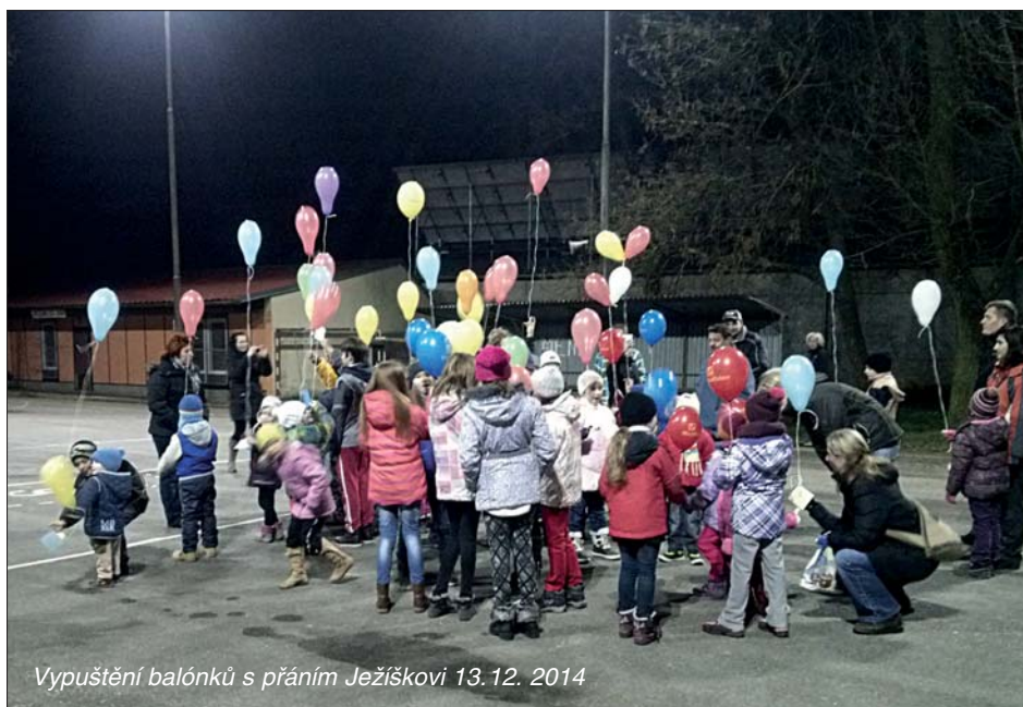
Vypuštění balónků s přáním Ježíškovi 13.12. 2014