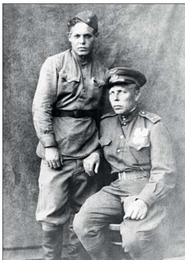
Příslušníci Rudé armády, účastníci bojů při osvobozování naší obce