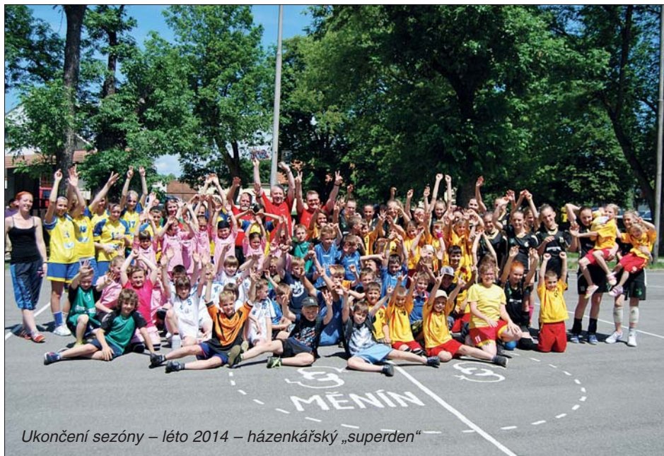
Ukončení sezóny – léto 2014 – házenkářský „superden“