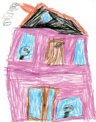
Nakreslil Kubík Urban