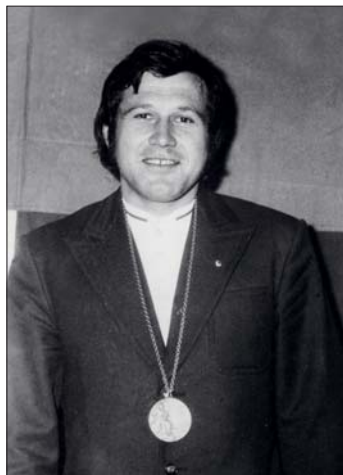
Jaroslav Konečný s olympijskou medailí z roku 1972