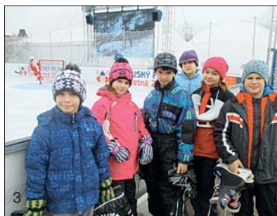
1 – Sokolské Brno 2010, 2 – Sokolský slet 2012, 3 – Olympijský park Letná 2014, 4 – Memoriál Otmara Grolicha 2013