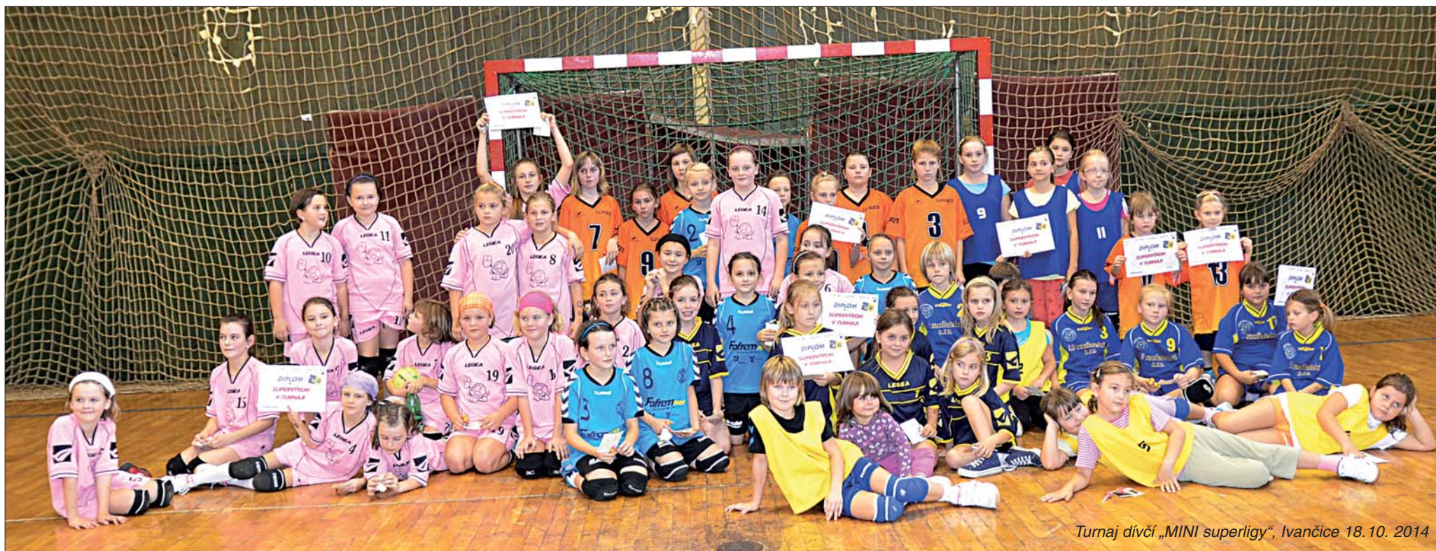
Turnaj dívčí „MINI superligy“, Ivančice 18.10. 2014