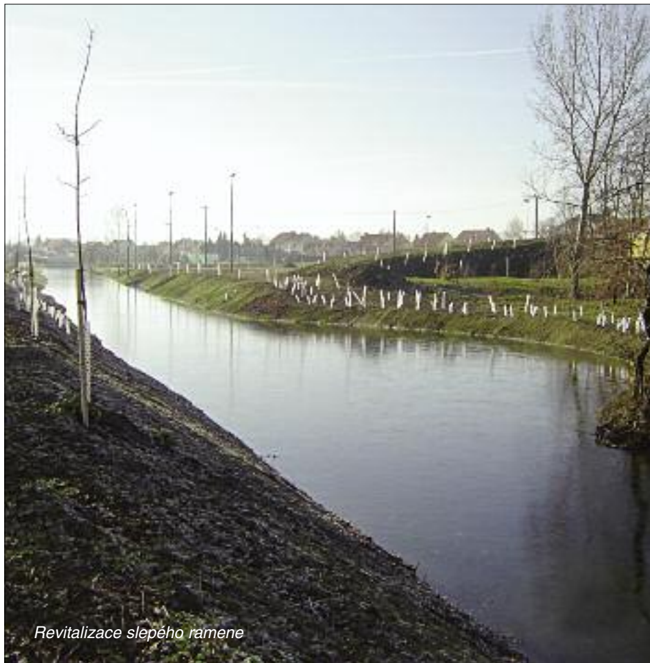
Revitalizace slepého ramene