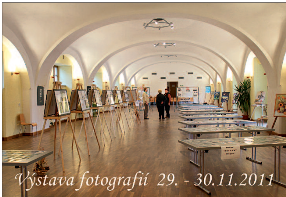
Výstava fotografií 29. - 30.11.2011

Další akce budeme zařazovat dle zájmu, programů divadel a jiných kulturních zařízení. Jste srdečně zváni.