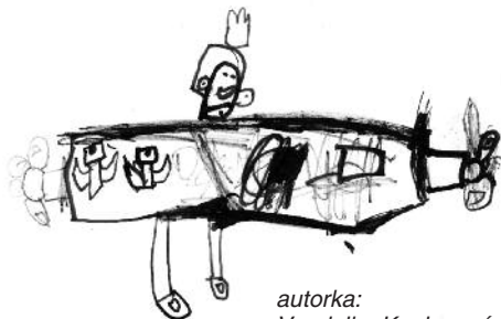
autorka: Vendulka Kaplanová

Finanční úřad Brno-venkov, Příkop 834/8, tel. 545 125 111, podatelna@brv.ds.mfcr.cz