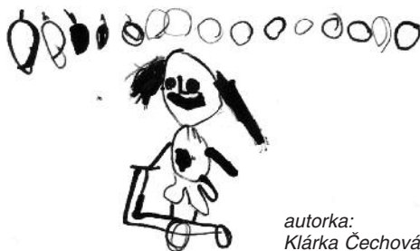
autorka: Klárka Čechová